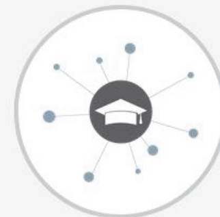
Search for equivalent opportunities