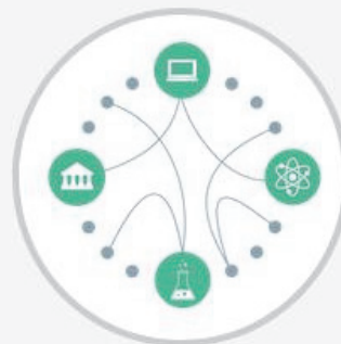
Search through job profiles